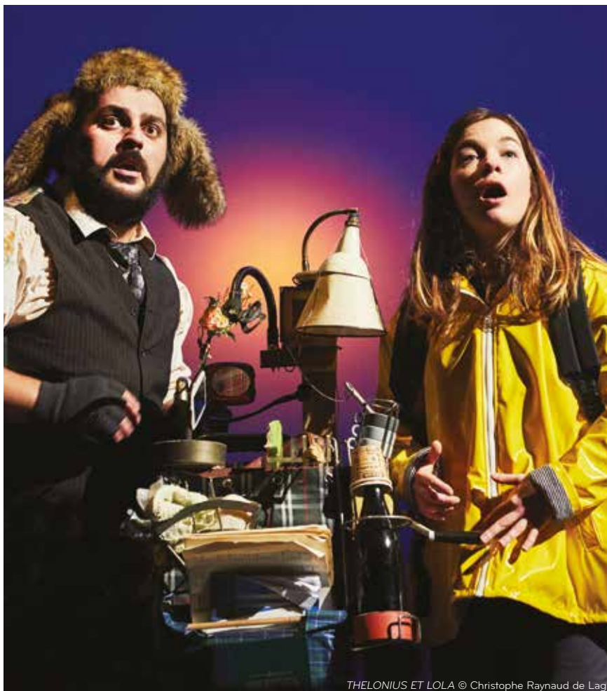
THELONIUS ET LOLA