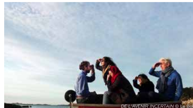
DE L'AVENIR INCERTAIN © Le Bob