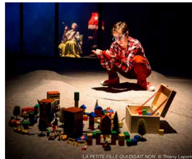
LA PETITE FILLE QUI DISAIT NON

« Moi ce que j'aime avec Louise c'est qu'on peut se parler de tout. On se dit des choses importantes. Des choses de la vie et de la mort. Les autres adultes font toujours des manières, comme si on ne pouvait pas comprendre. Ils font comme s'ils détenaient tout un tas de secrets. Ils prennent des airs mystérieux et disent : « Tu comprendras plus tard ». Louise dit que ça n'existe pas, plus tard, qu'il ne faut pas croire qu'il y ait un âge où soudain tout s'éclaircit, où on comprend tout soudain comme par magie. Louise dit que dans le fond les adultes sont juste des enfants qui ont grandi trop vite. Si c'est ça, c'est vraiment pas la peine de faire toutes ces manières. »