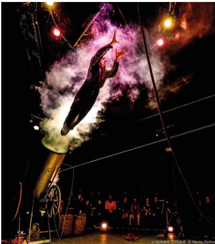
L'HOMME CIRQUE © Martin Pelikan

Conception et interprétation David Dimitri