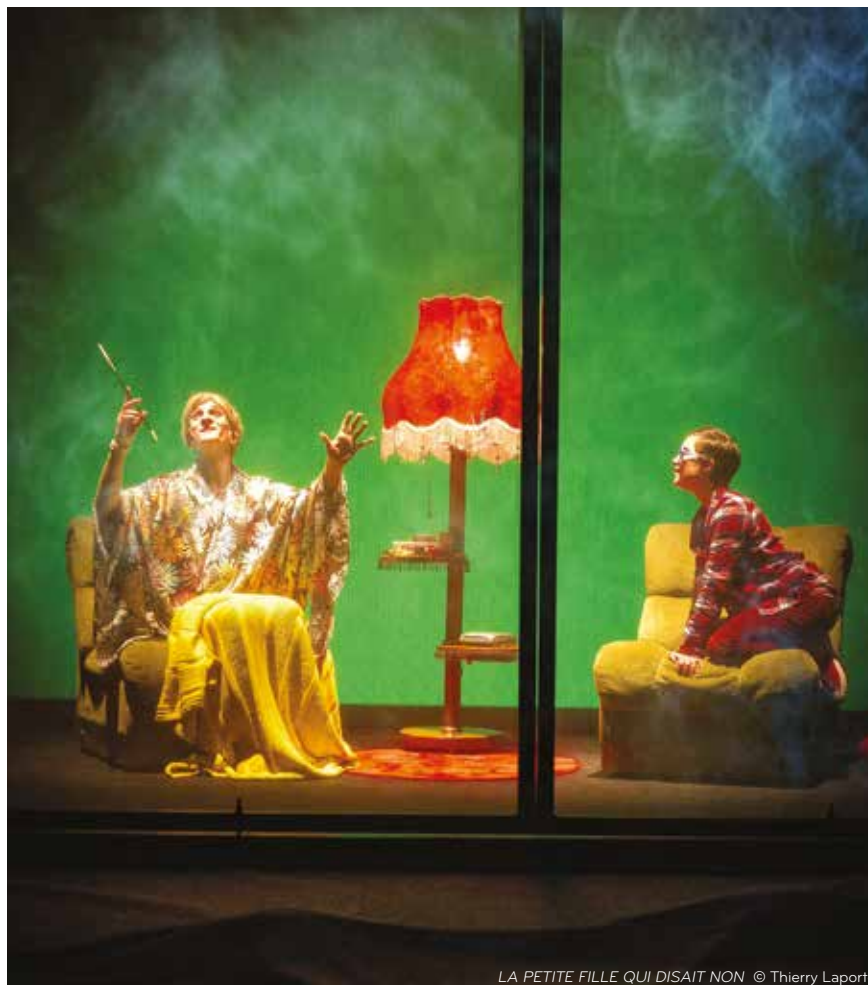
LA PETITE FILLE QUI DISAIT NON